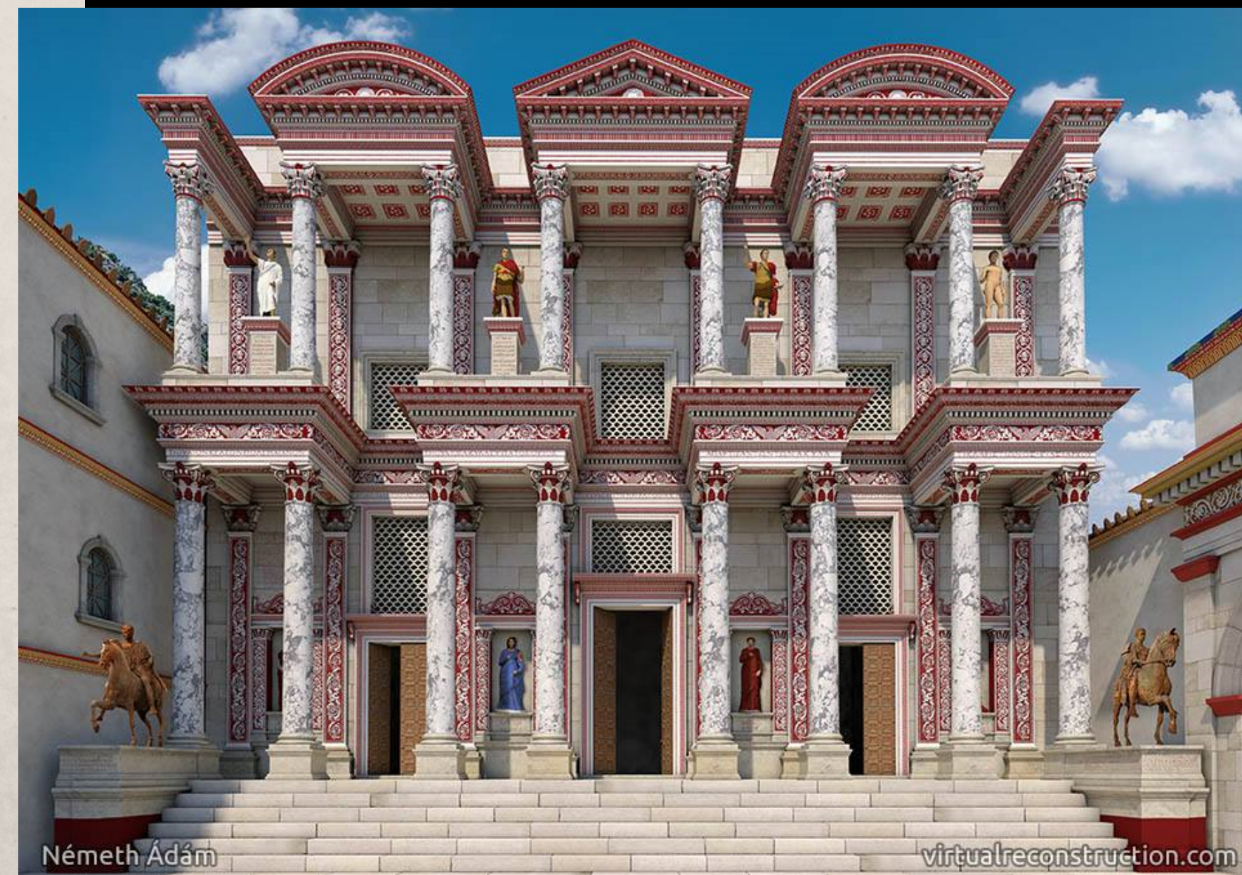
Реконструкция библиотеки Цельса в Эфесе (113-135 гг.)