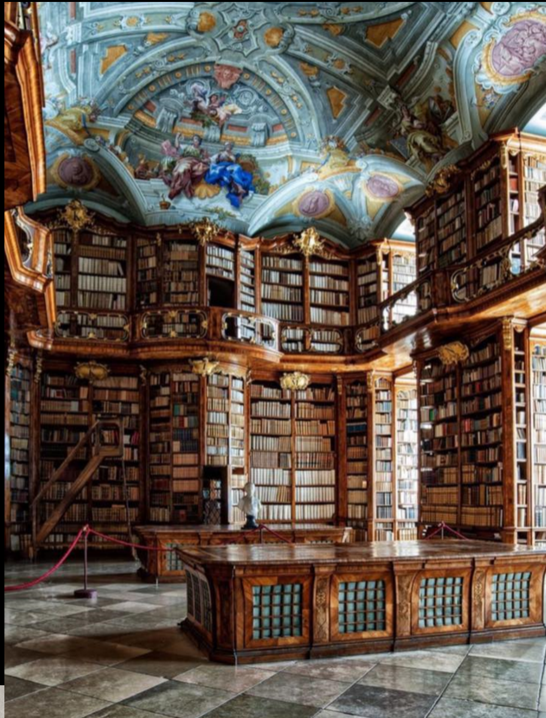
Библиотека св. Флориана, Австрия, 1744г.