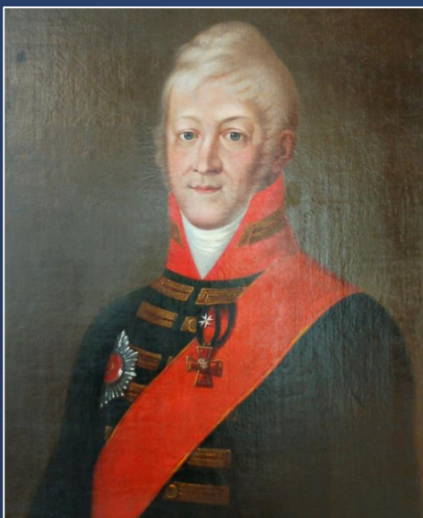
Кампенгаузен Балтазар Балтазарович

Первым Государственным контролером являлся барон Балтазар Балтазарович Кампенгаузен. При нем был организован Совет государственного контроля. В последующем Государственный контролер и Совет государственного контроля сосредоточили свою деятельность на совершенствовании отчетности и основных положений реформы ревизионно-финансового управления, на улучшение способов и приемов контрольных проверок.