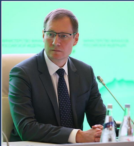
Артюхин Роман Евгеньевич (Руководитель Федерального казначейства)

(Артюхин Р.Е. Газета «Коммерсантъ» №227 от 14.12.2021, стр. 1)