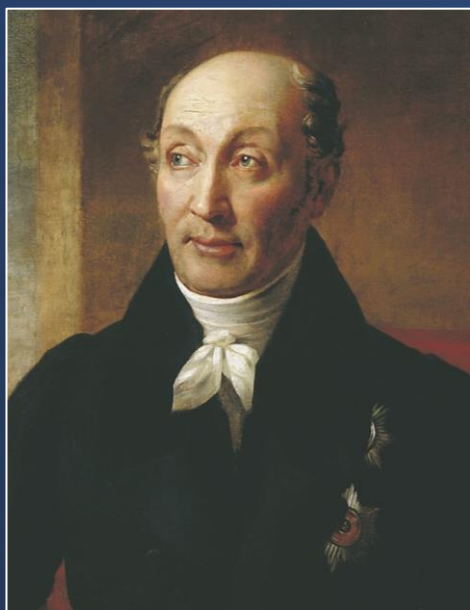
Сперанский Михаил Михайлович

В 1836 году главное управление было преобразовано в Государственный контроль. С этого момента и начинается история Государственного контроля, как отдельного, независимого и самостоятельного учреждения в системе других органов государственного управления.