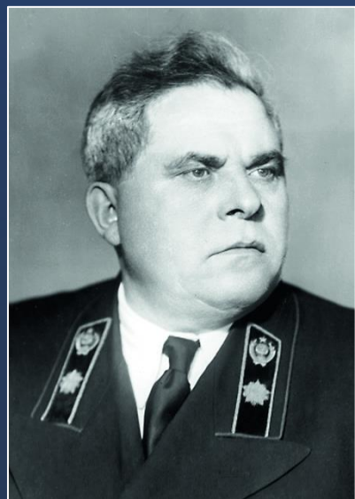
Зверев Арсений Григорьевич

В январе 1938 года на пост Наркома финансов СССР был назначен государственный деятель – финансист Зверев Арсений Григорьевич, который всегда ставил значение контроля очень высоко. 9 мая 1938 г. СНК СССР утвердил Положение о Контрольно-ревизионном управлении Наркомфина СССР, подготовленное при участии А.Г. Зверева.