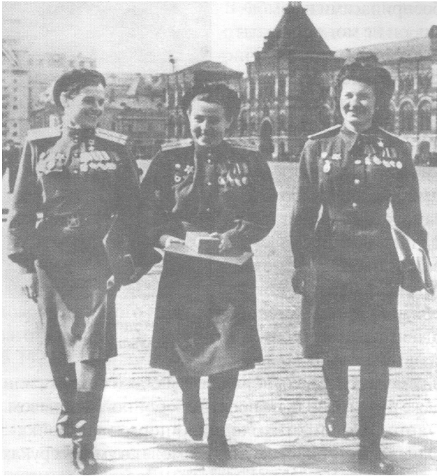
Май 1946 года. На Красной площади (слева направо) — Герои Советского Союза, отважные летчицы Марина Чечнева, Полина Гельман, Раиса Аронова.

мотор не наберет обороты, затем по команде отскакивают. Взлет почти вертикальный! Интересно, что похожая технология применяется сейчас для взлета с короткой палубы авианесущих крейсеров.