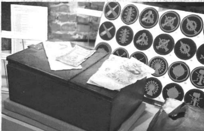
Ящик «241» Волжско-Камского банка в Петербурге, конец XIX - начало XX в. Денежный ящик предназначался для хранения и перевозки кассы воинского подразделения

Подробная раскладка о производстве денежного довольствия по штатам, на основании Высочайшего манифеста от 1 июля 1839 г. переложенным на серебро, утверждена Николаем I Романовым в 1842 г. В раскладке представлены оклады и жалования по должностям, начиная от генералитета и заканчивая расчетами за чины, ордена и знаки безупречной службы