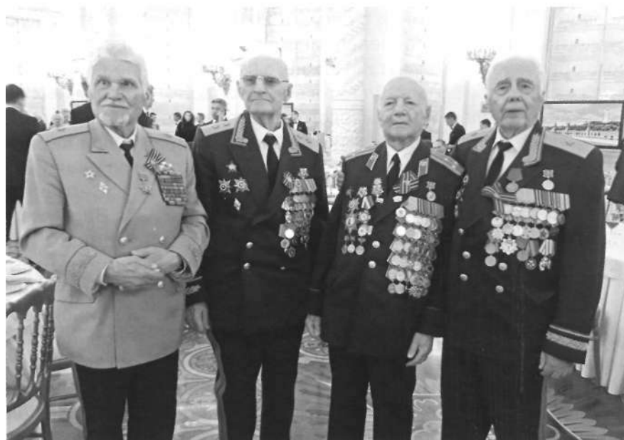
Ветераны финансово-экономической службы Вооруженных Сил Российской Федерации, участники Великой Отечественной войны (слева направо): генерал-майор в отставке С. Г. Едыкин, генерал-лейтенант в отставке М. И. Полищук, полковник в отставке И. Л. Смоляр, генерал-майор в отставке СМ. Ермаков на торжественном приеме от имени Президента Российской Федерации в Кремле, 9 мая 2018 г., г. Москва

Планируется несколько этапов перевода сопровождаемых