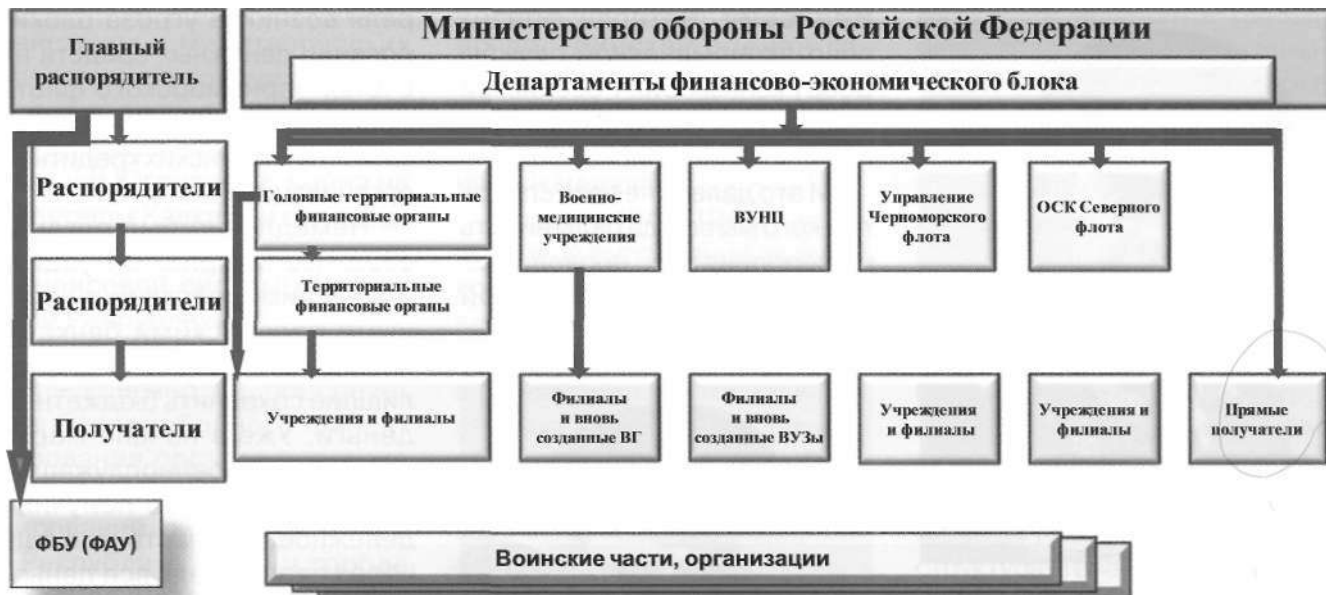
Схема финансового обеспечения войск (сил) с 1 января 2019 г.

средства федерального бюджета, исключая риск их потери.