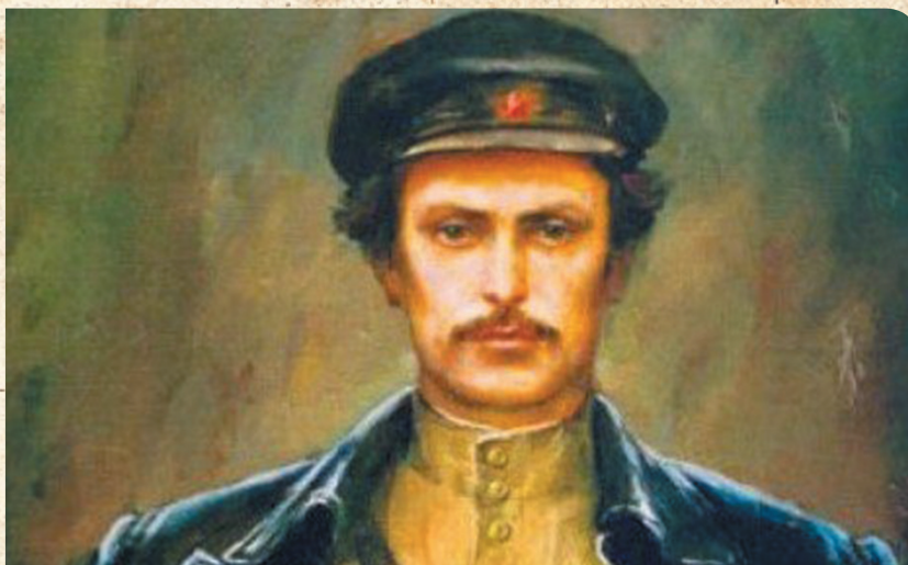
М.В.Лезгинцев — первый главный военный финансист РККА

На заре советской эпохи имя М.В.Лезгинцева часто встречалось в по-