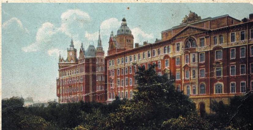
Дом страхового общества «Россия» на Сретенском бульваре в Москве, в котором в 1918 г. расположился финансовый отдел при Реввоенсовете. Архитектор Н.М.Проскурин, 1899–1902 гг. (Открытие начала XX в.)