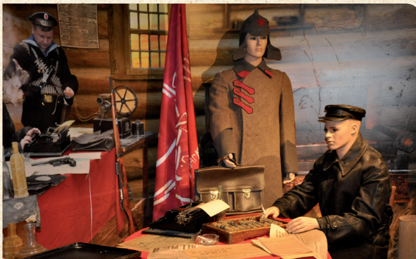
Финансовый отряд Реввоенсовета. Экспозиция, посвященная столетию финансовой службы Вооруженных сил, Центральный музей Вооруженных сил России, 2018 г.