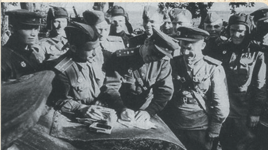
Подписка на военный заем 1943 г. в боевой танковой части