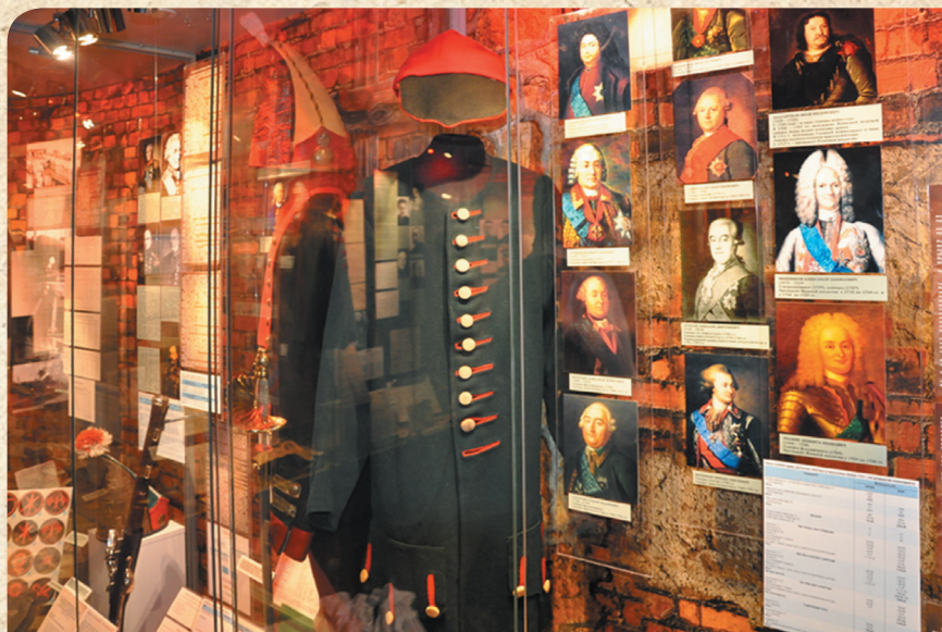
Мундир армейского финансиста эпохи Екатерины II. Экспозиция, посвященная столетию финансовой службы Вооруженных сил, Центральный музей Вооруженных сил России, 2018 г.

Позже Бонапарт оплатит России в прямом смысле той же монетой: русские солдаты и офицеры, плененные под Аустерлицем в 1805 г., по велению Наполеона получали жалование по штату французской армии. Тогда зарплата во-