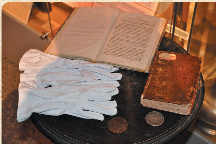
Дошедшие до наших дней документы XVIII в., регламентирующие финансовую работу в армии. Экспозиция, посвященная столетию финансовой службы Вооруженных сил, Центральный музей Вооруженных сил России, 2018 г.

енного в республике была выше российской в полтора раза.