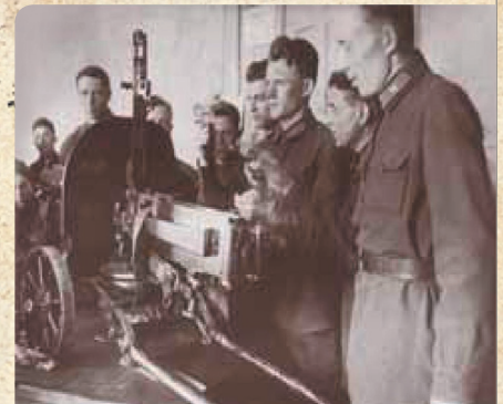
Военно-финансовые курсы Северо-Кавказского военного округа. Слушатели курсов за изучением материальной части пулемета, 1934–1935 гг.