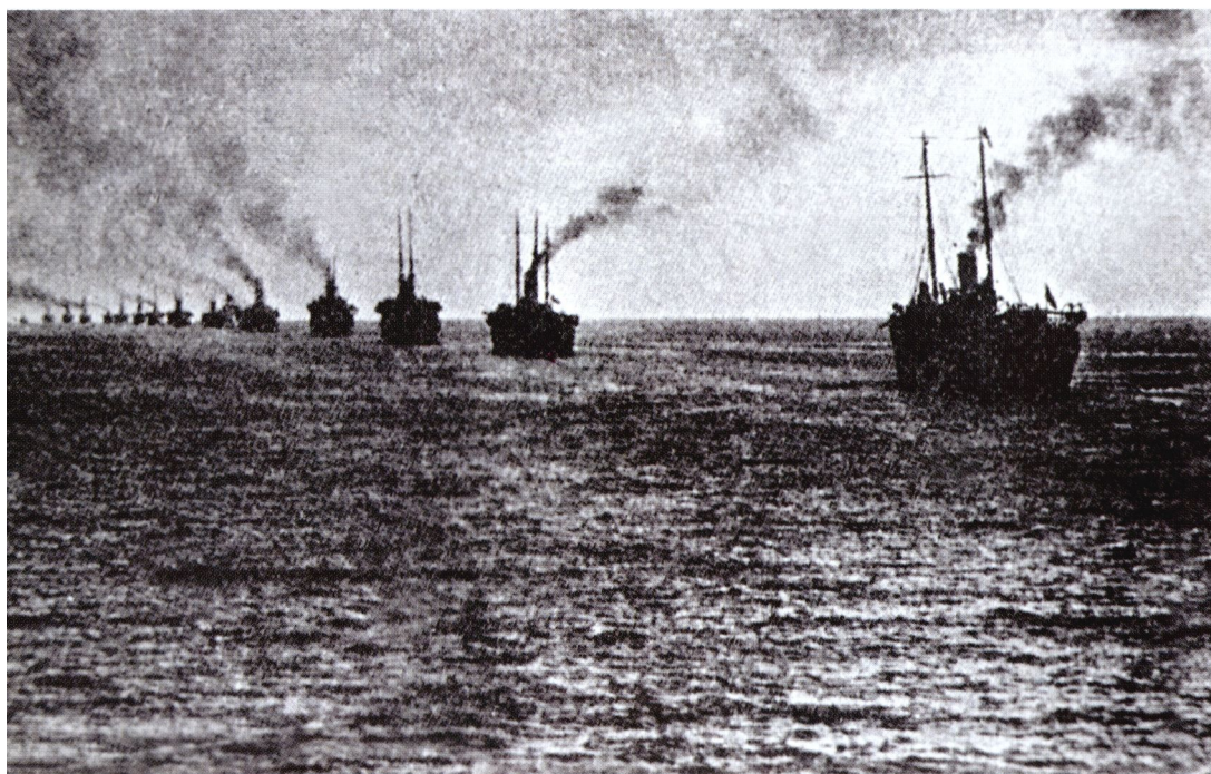
Кильватерная колонна транспортов в дни эвакуации из Крыма «белых» войск.