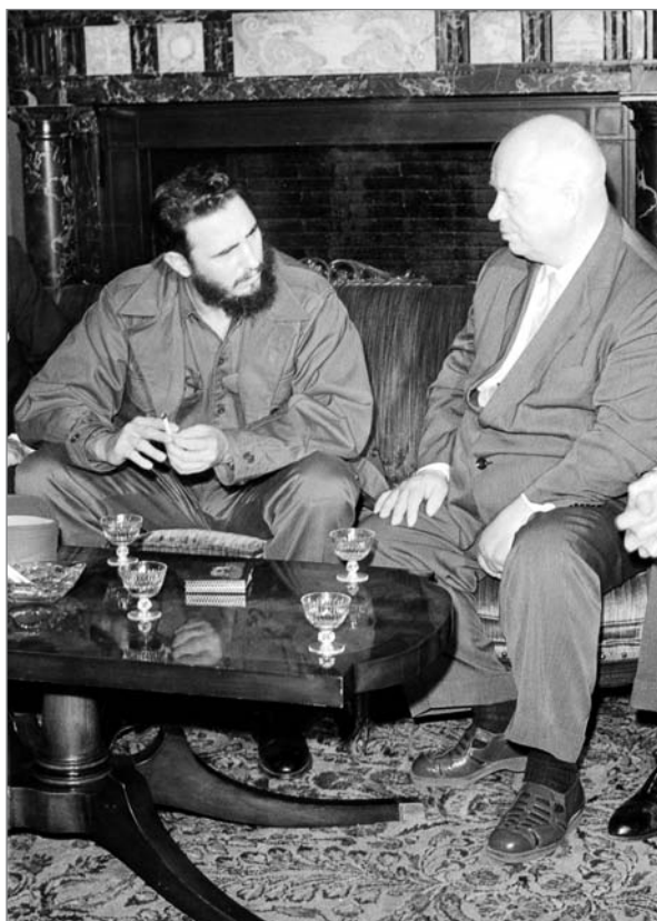
Председатель Совета министров СССР Н. С. Хрущёв и премьер-министр Кубы Фидель Кастро в перерыве между заседаниями XV сессии Генеральной Ассамблеи ООН. Нью-Йорк, сентябрь 1960 г.